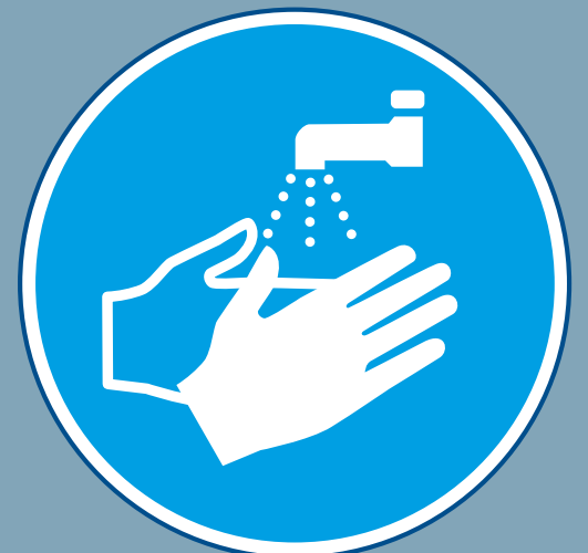
HANDEN WASSEN VERPLICHT