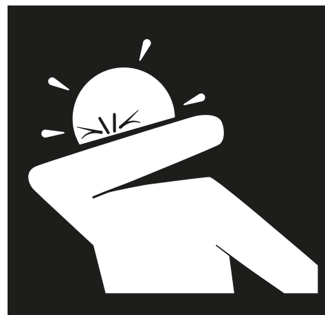
Hoest en nies in de binnenkant van je elleboog