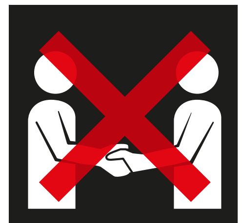
Geen handen schudden