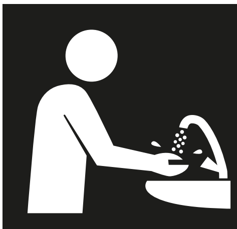
Was je handen regelmatig