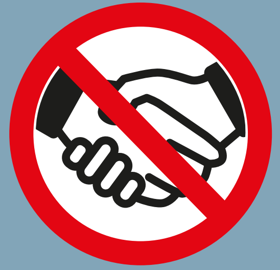
GEEN HANDEN SCHUDDEN